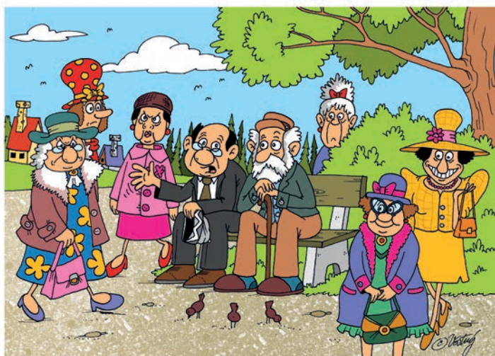
Léto končí, začíná babí léto. Jdeme domů Pepo, není již na co koukat.

PILSEN - plzeňský senior - vyzrálý magazín