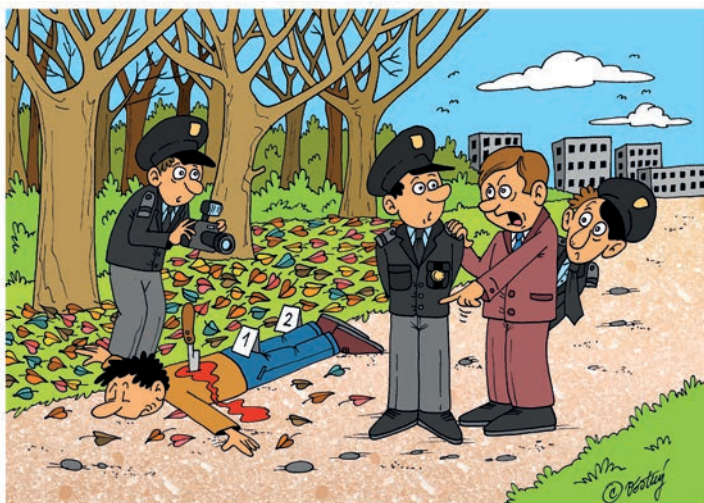
Všechno listí posbírejte kvůli otiskům!