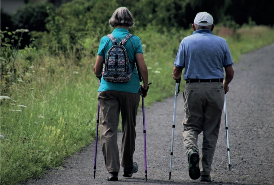
Ilustrační foto: archiv ÚMO 1

V polovině září odstartovala podzimní část projektu Jedeme dál, který zahrnuje oblíbené organizované kurzy chůze Nordic Walking v rekreační oblasti Boleveckých rybníků. Zájemci nyní každý týden absolvují dvě lekce, celkově pak kurzy trvají osm týdnů až do 4. listopadu. Projekt Jedeme dál je určen zejména seniorům z Klubu Jednička, který se zaměřuje na podporu vybraných skupin obyvatel prvního plzeňského městského obvodu. Přihlásit se však mohli i senioři, kteří v obvodu trvalé bydliště nemají.