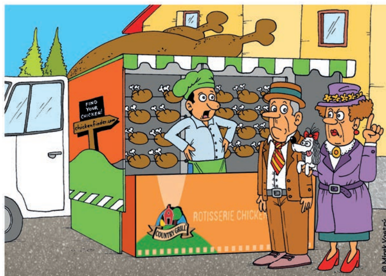
Rozumím madam, tři libvoučká prsíčka pro pejska a dva krajíce chleba pro pána...

PILSEN - plzeňský senior - vyzrálý magazín