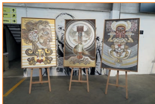
triptych Vzmachuzmar